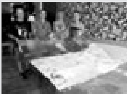
I creativi di Latina

I 150 anni dell'Unità nazionale vedono protagonista anche la città di Latina, grazie all'iniziativa «Tre colori, una bandiera e un sacco di artisti»: un evento itinerante, che coinvolge centinaia di creativi di tutta Italia, impegnati a interpretare il tricolore e ciò che rappresenta per loro. Sabato scorso la bandiera è arrivata a Latina, dopo un lungo viaggio iniziato il 17 marzo scorso, giorno del 150esimo anniversario,